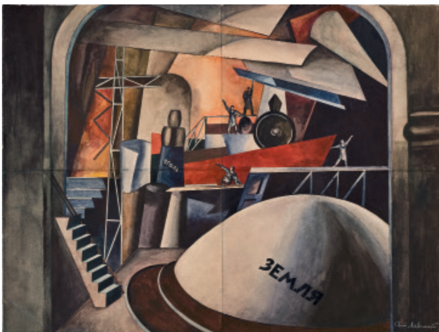
А.М. Лавинский, эскиз декорации к «Мистерии-буфф» В.В. Маяковского, 1921 г.

У картины было не очень много владельцев. Как и эскизы к