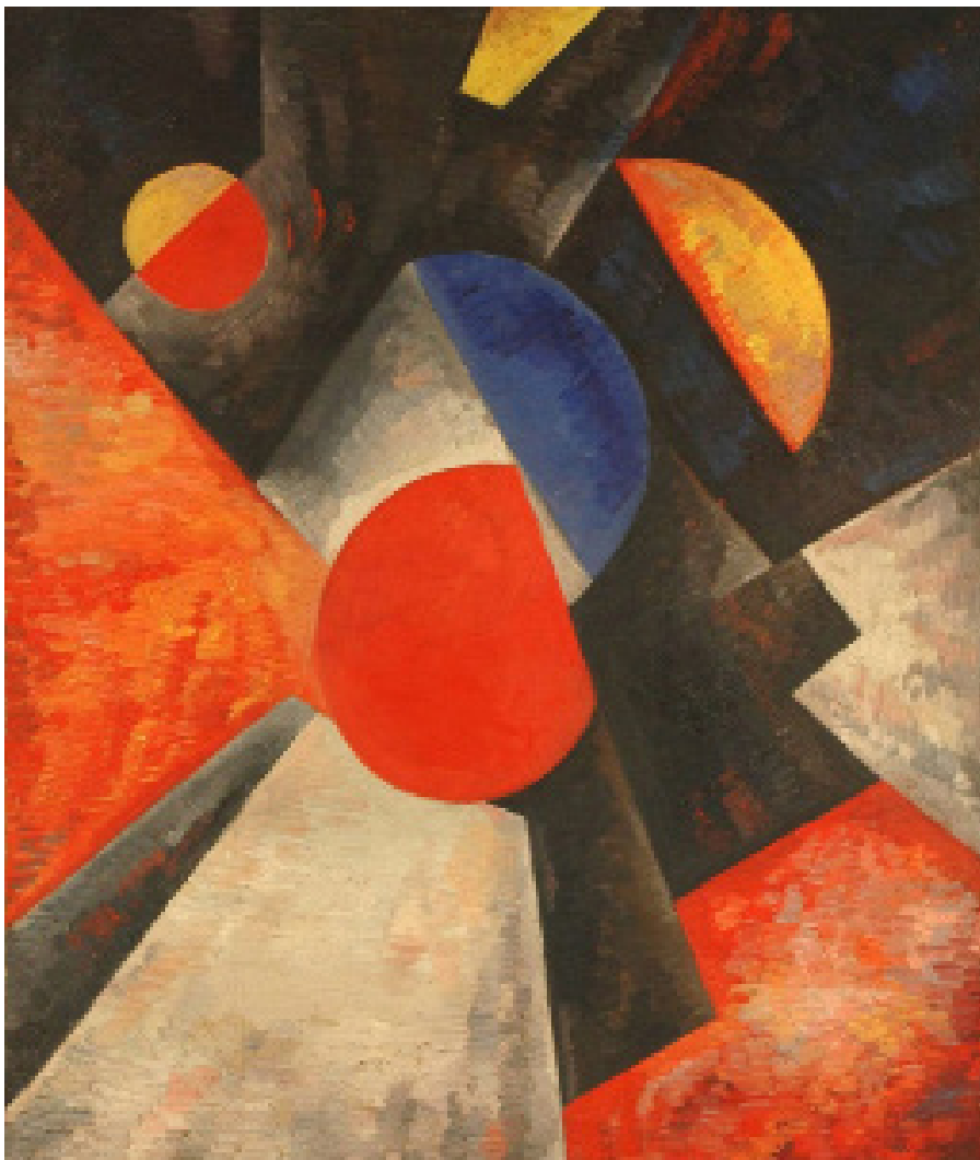
А.А. Экстер, «Абстрактная композиция», 1917–1918 гг.