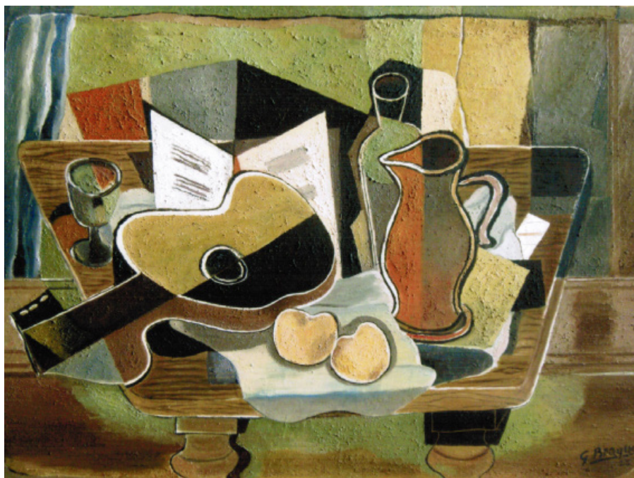
Ж. Брак, «Натюрморт с гитарой», 1928 г.