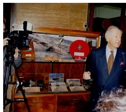
Национальный естественно-научный музей при Академии наук в Софии: у витрины с породой с Марса, экспонируемой между лунными породами, подаренными Болгарии США и СССР

нах мира в последние четыре десятилетия.