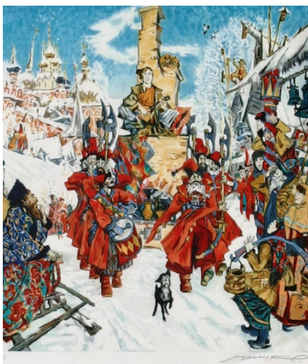
С. Чепик, «Емеля»

А.А. Экстер относится к тому периоду творчества художницы, который очень высоко оценивают исследователи – от Я. Тугенхольда и А. Эфроса (современников А. Экстер) до Г. Коваленко (нашего современника). В те годы она в своих произведениях выходит в чистую беспредметность, создавая «Цветовые ритмы» и «Цветовые динамики» – собственный вариант абстрактного искусства, отличный и от супрематизма К. Малевича, и от архитектурной Л. Поповой, и от цветописи О. Розановой.