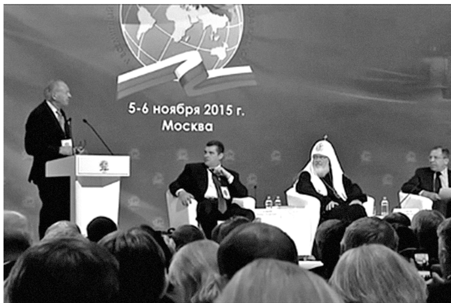
Слева направо: Н.Д. Лобанов-Ростовский, депутат Э.Л. Слуцкий, Патриарх всея Руси Кирилл, министр С.В. Лавров. V Всероссийский конгресс соотечественников. Москва, 5 ноября 2015 г.

И Вы достойно и умело защищаете интересы России. В этом контексте, в знак своего уважения к Вам, я оставил для Вас обрамленную картину министра иностранных дел Лобанова-Ростовского и, узнав, что в музее Министерства нет этого изображения, оставил и второй экземпляр».