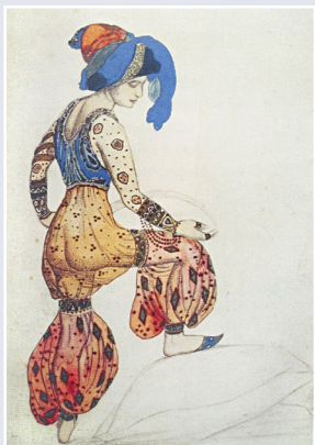
А. Бакст. Эскиз костюма Синей султанши. «Шехерезада». 1910 г.