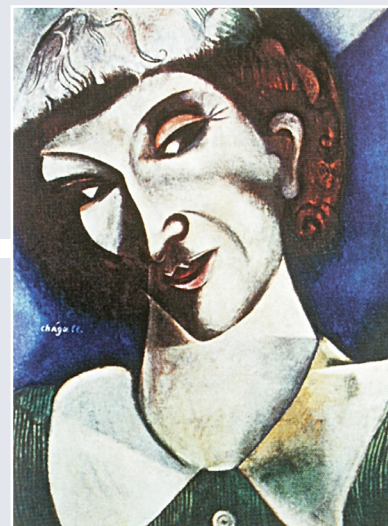
М. Шагал. Автопортрет. 1913 г.

России, как он говаривает, «исполненной цвета, радости, тепла и гуманизма».