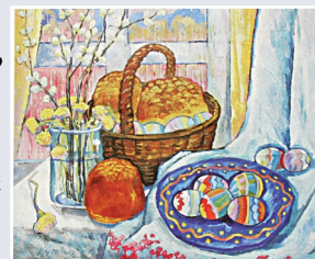
Н. Гончарова. Пасхальный натюрморт. Х., м. 90х89 см. 1908 г.