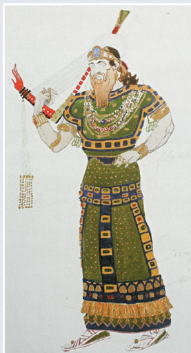
Л. Бакст. Эскиз костюма сирийского арфиста. «Клеопатра». 1910 г.