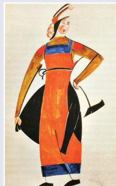
В. Татлин. Эскиз костюма крестьянской девушки к опере «Жизнь за царя». 1913 г.