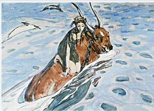
В. Серов. Похищение Европы. 1910 г.