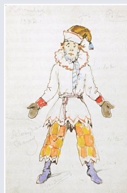
А. Бенуа. Эскиз костюма Петрушки. 1936 г.