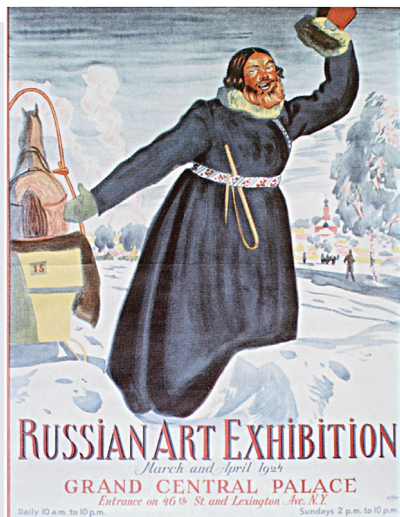
Б. Кустодиев. Афиша выставки русского искусства. Нью-Йорк. 1924 г.