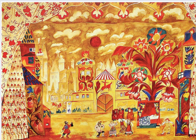
М. Ларионов. Эскиз декорации к балету «Полуночное солнце». 1915 г.