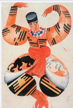
П. Челищев. Эскиз костюма танцовщица, балет труппы В.П. Зилина. Стамбул. 1920 г.