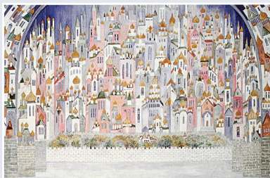
Н. Гончарова. Эскиз задника к финалу «Жар-птицы» И. Стравинского. 1926 г.