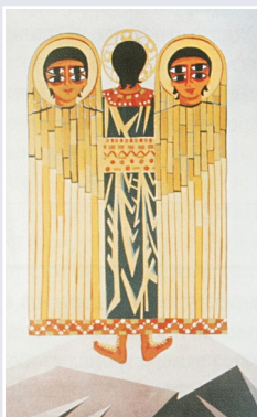
Н. Гончарова. Восьмиглазый херувим. «Литургия». 1915 г.