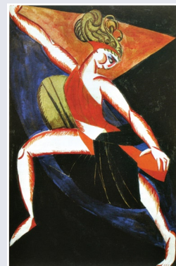
А. Экстер. Эскиз костюма вакханки к спектаклю «Фамира-Кифаред». 1916 г.