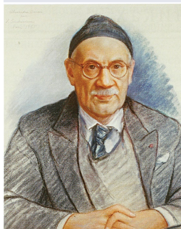
З. Серебрякова. Портрет Александра Бенуа. Пастель. Париж. 1955 г.

Но главная профессия князя есть и будет коллекционирование. Здесь он во всеоружии: знание всех тонких приемов сыска желанного предмета, обольщение его владельца, часто капризного и случайного, скрупулезное фиксирование