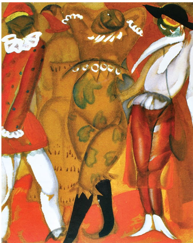
Б. Григорьев. Актеры в масках . 1920 г.