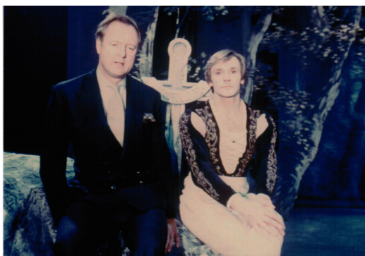
С Владимиром Васильевым в киностудии во время съемок фильма-балета «Жизель». Локарно. 1985